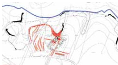
plan des interventions sur le paysage

La deuxième commande a été passée à Edison Simons, poète panaméen vivant et travaillant à Paris. Le Studio Milou Architecture lui avait demandé plusieurs textes poétiques libres pour le jardin des oiseaux libres en 2000 et 2001.