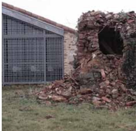
angle de la grange