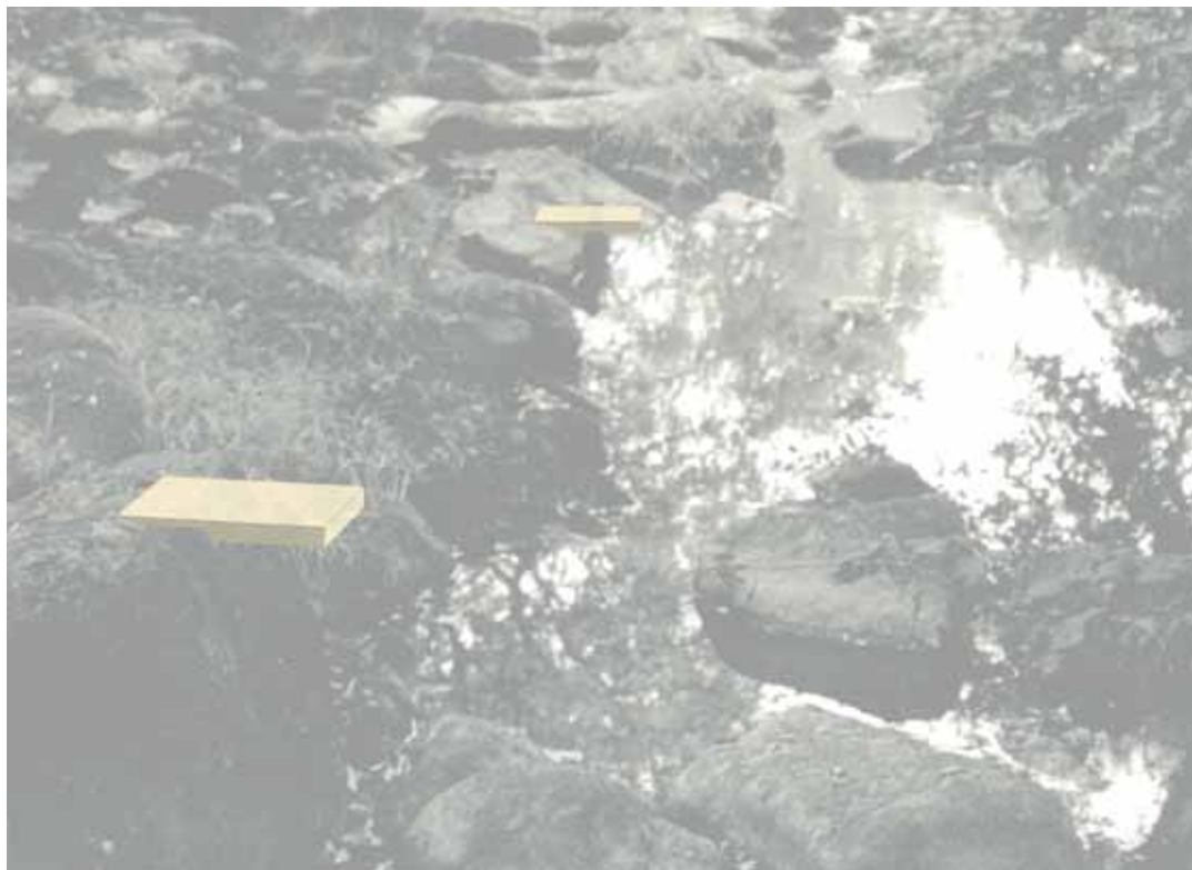
pour les oiseaux

Surface shon : 70 ha Montant des travaux : 0,36 M € HT Livraison: mars 2002