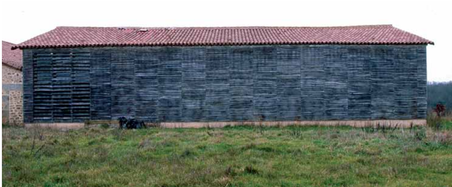
la grange et sa façade vernaculaire