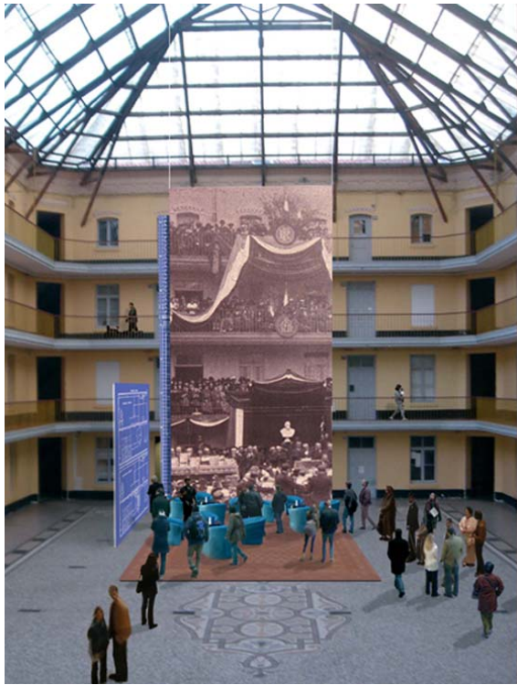
Perspective sur la cour