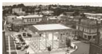
place de l'Eglise et marché couvert