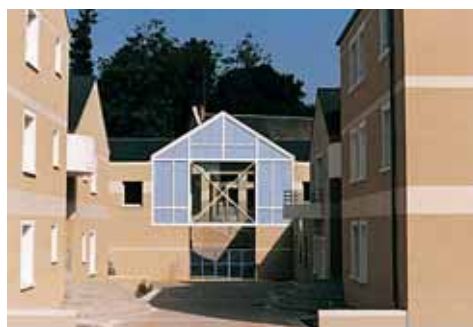
école Pérochon, façade d'entrée