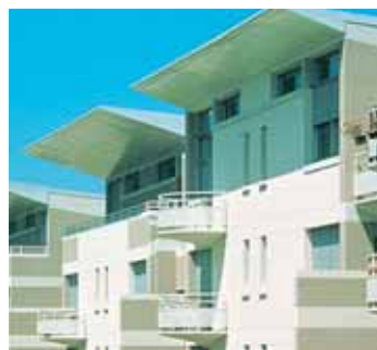
détail du logement Baudin